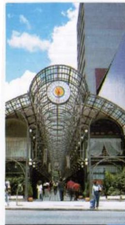
Rua 24 Horas O ponto de encontro da cidade, em todas as horas do dia e da noite.