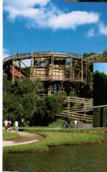
Universidade Livre do Meio Ambiente Bosque Zaninelli. O estilo arrojado de sua construção arquitetônica, constitui-se em uma atração em si.