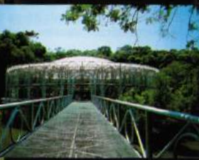
Ópera de Arame Em meio a bonita paisagem, destina-se à apresentações artísticas e culturais.