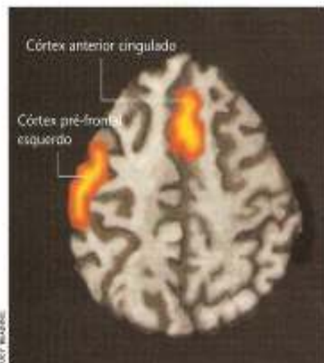
REPRESENTAÇÃO GRÁFICA de uma fatia do cérebro destaca duas áreas mais ativas quando uma pessoa mente: a que contém a verdade e a que formula a informação falsa

Através dessa observação é possível constatar que a região dos lobos frontais são mais ativados quando estamos falando a verdade (figura da esquerda) e no córtex anterior cingulado e lobo frontal esquerdo, quando estamos mentindo. Há estudos demonstrando quotas de acerto em 90% dos casos.